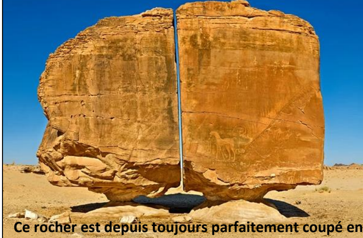
Ce rocher est depuis toujours parfaitement coupé en deux sans explication.