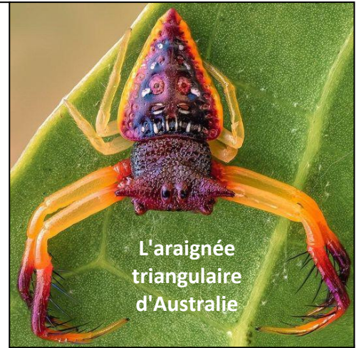
L'araignée triangulaire d'Australie

Pour nous écrire ? courriel@trazibule.fr www.trazibule.fr